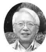
城北地区 活動推進相談員