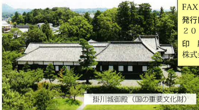
掛川城御殿(国の重要文化財)

所在地/〒436-0079 掛川市掛川1138番地の24 開館時間/9時から17時(入館は16時30分まで) ※年中無休 入館料/大人(個人)410円 大人団体(20名様以上)320円 小中学生(個人)150円 小中学生団体(20名様以上)120円 駐車場/近隣の有料駐車場をご利用ください。 問い合わせ/☎0537-22-1146 ホームページ/ http://www.kakegawajo.com