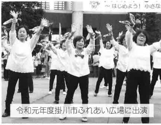
令和元年度掛川市ふれあい広場に出演

今年度はコロナウイルス感染症拡大防止のため、6月1日(月)に予定していた「シニアクラブ掛川支部女性部総会」は中止とさせていただきます。ご了承ください。