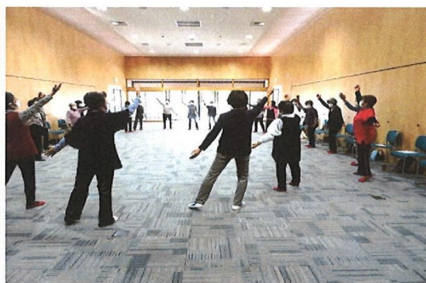
レクダンスクラブ (写真はレクダンス講習会の様子)