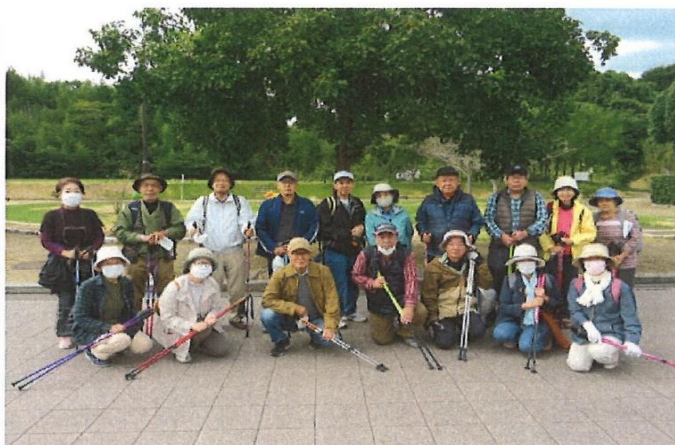
ノルディック・ウォーキング