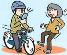
スマホ等使用運転