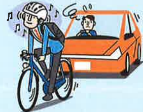
イヤホン等使用運転