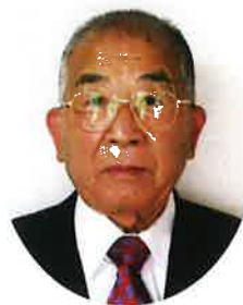
会長より新年のご挨拶

[発行]さわやかクラブやいづ連合会 焼津市宗高572-1 大井川福祉センター「ほほえみ」内 TEL:054-622-3543 メールアドレス：sawayakclubyaizurengoukai@yahoo.co.jp